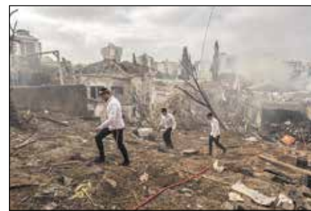
Ruinele unor clădiri distruse în timpul atacului cu rachete din Iran. Rehovot, 15.06.2025.