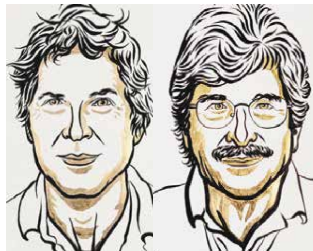
Interviuri cu laureații Nobel – David Baker și Gary Ruvkun