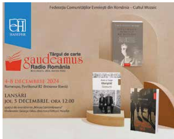
Maraton editorial propus de Hasefer la Târgul Gaudeamus