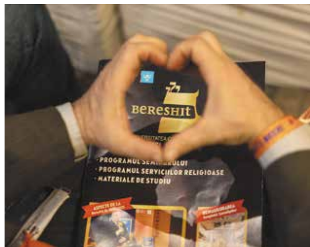
Bereshit, ediția 22 (Bacău) Israel BeLibeinu