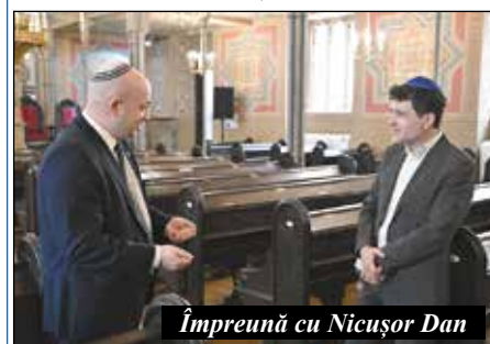
Împreună cu Nicușor Dan

Cei trei lideri ai FCER i-au prezentat primarului general modele și exemple de bune practici pe care le-au întâlnit, dar și reușitele obținute cu un efort deosebit de către Federație și comunitățile evreiești din țară.