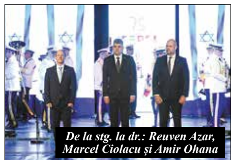
De la stg. la dr.: Reuven Azar, Marcel Ciolacu și Amir Ohana

Amir Ohana, președintele Knessetului, a vorbit despre renașterea poporului evreu după Holocaust. În pofida adversităților, supraviețuitorii au reușit să facă progrese, să-și creeze un viitor luminos în care toate minoritățile să trăiască în pace. Referindu-se la Ziua Ierusalimului, marcată după